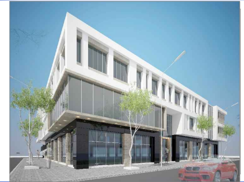
CENTRE MÉDICAL SAPHIR

CONSTRUCTION D'UN ENSEMBLE RESIDENTIEL A USAGE BUREAUTIQUE, HABITATION ET COMMERCIAL PROJET : EN SOUS SOL-R+2 SIS A BORDJ LOUZIR-ARIANA